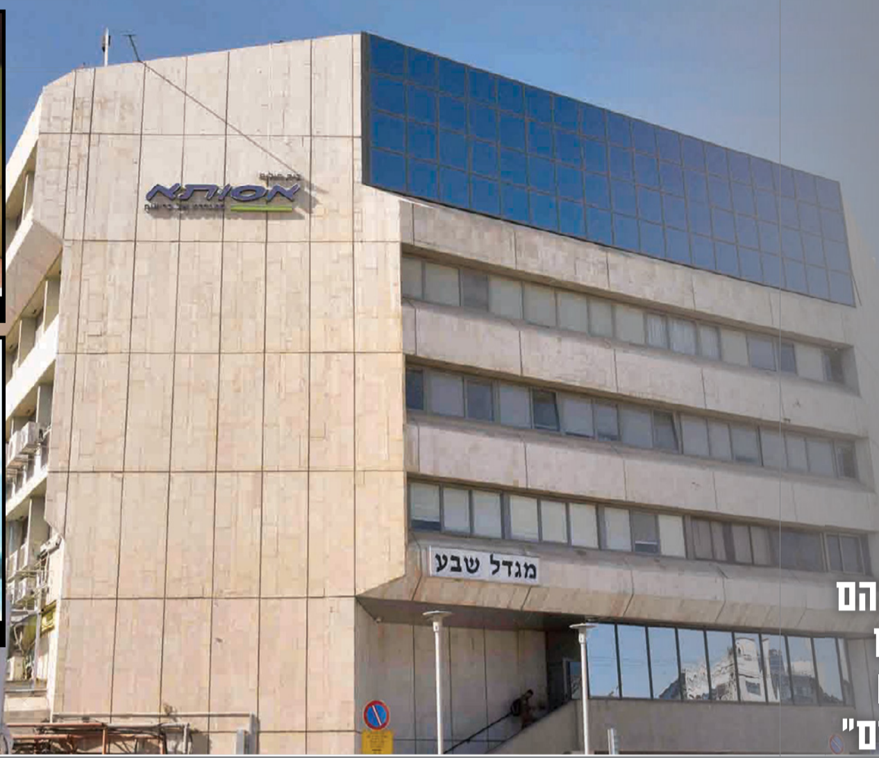
בי"ח אסותא בבאר שבע. ביקורת קשה מצד משרד הבריאות

לבתי החולים הפרטיים יש תדמית של טיפול איכותי ויוקרתי במיוחד • אלא שדו"ח חמור במיוחד של משרד הבריאות חושף: הסכנה לטופלים בהם עלולה להיות גדולה יותר מאשר בבתי החולים הציבוריים • הסיבה: רבים מהם לא ערוכים לטיפול בסיבוכים • משפחות שתי מטופלות, שנפטרו עקב סיבוכי ניתוח בבי"ח אסותא, טוענות: "בבי"ח ציבורי חייהן היו ניצלים"